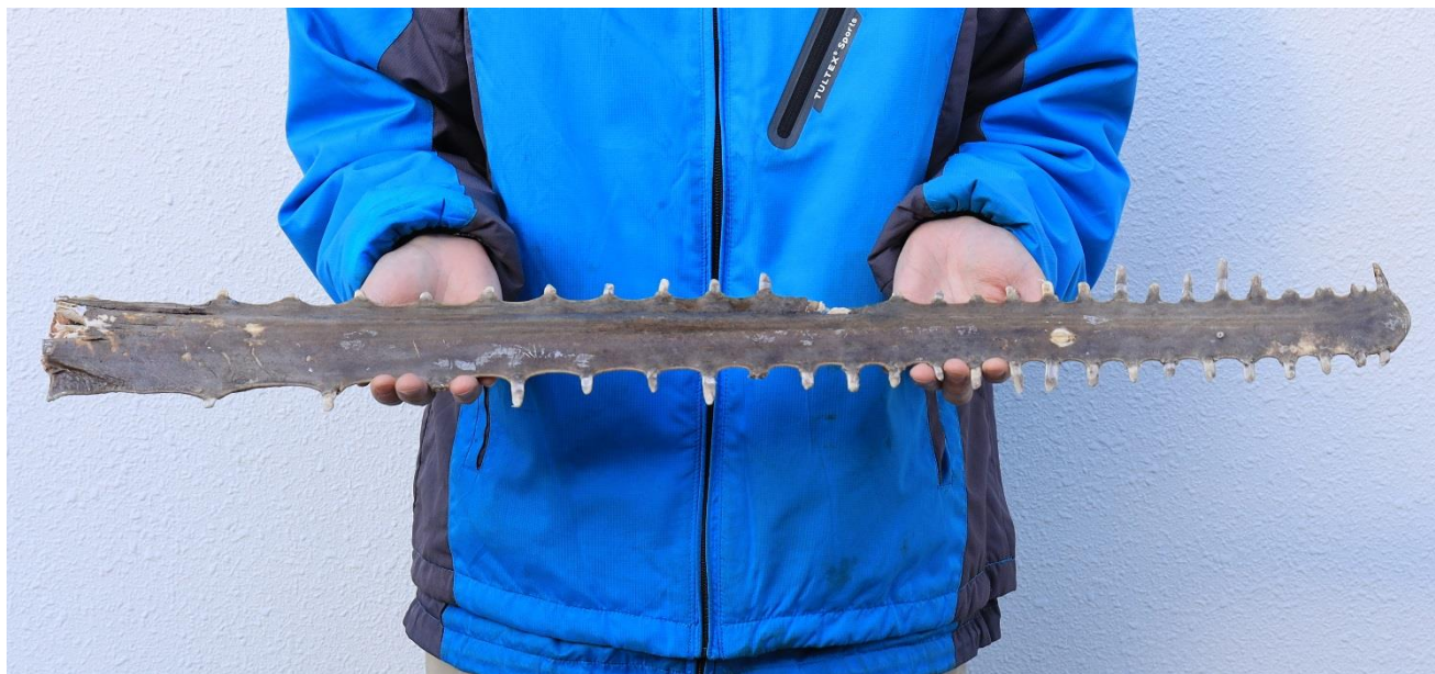
写真：御分霊を賜ったノギリエイの吻先